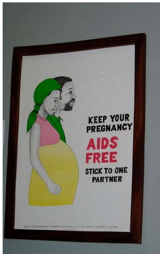
Aidsforebyggende arbeid i Malawi

fått er at de ikke har hatt nevneverdige problemer med å skaffe seg jobb etter endt utdanning. Alle de som svarte på vår henvendelse fikk spørsmål om de ville valgt utenlandspraksis igjen. Hele 93 % av dem svarte at de ikke ville vært foruten utenlandspraksis.