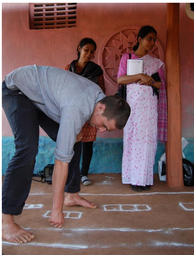
Samarbeid med indiske studenter.