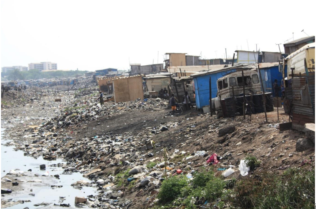
Konkomba Market, Accra

Shulman, Lawrence (2003). Kunsten å hjelpe . Oslo: Gyldendal akademisk forlag.