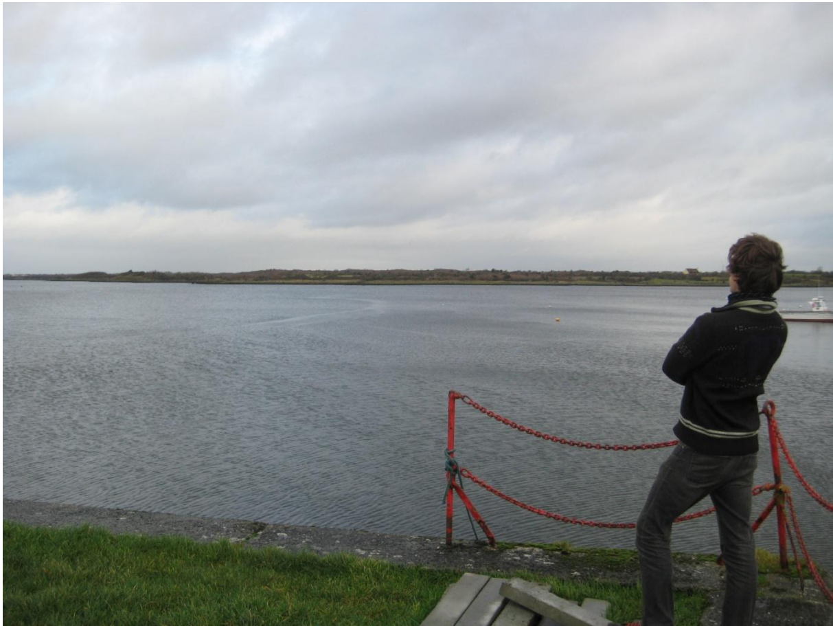
Tralee, Irland.