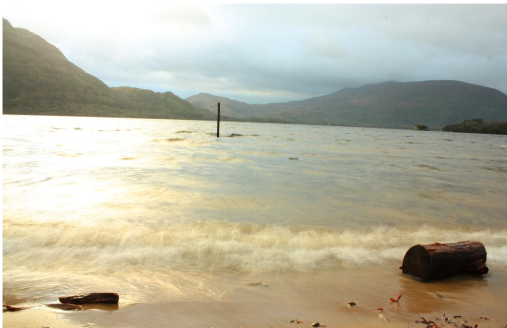
Tralee, Irland