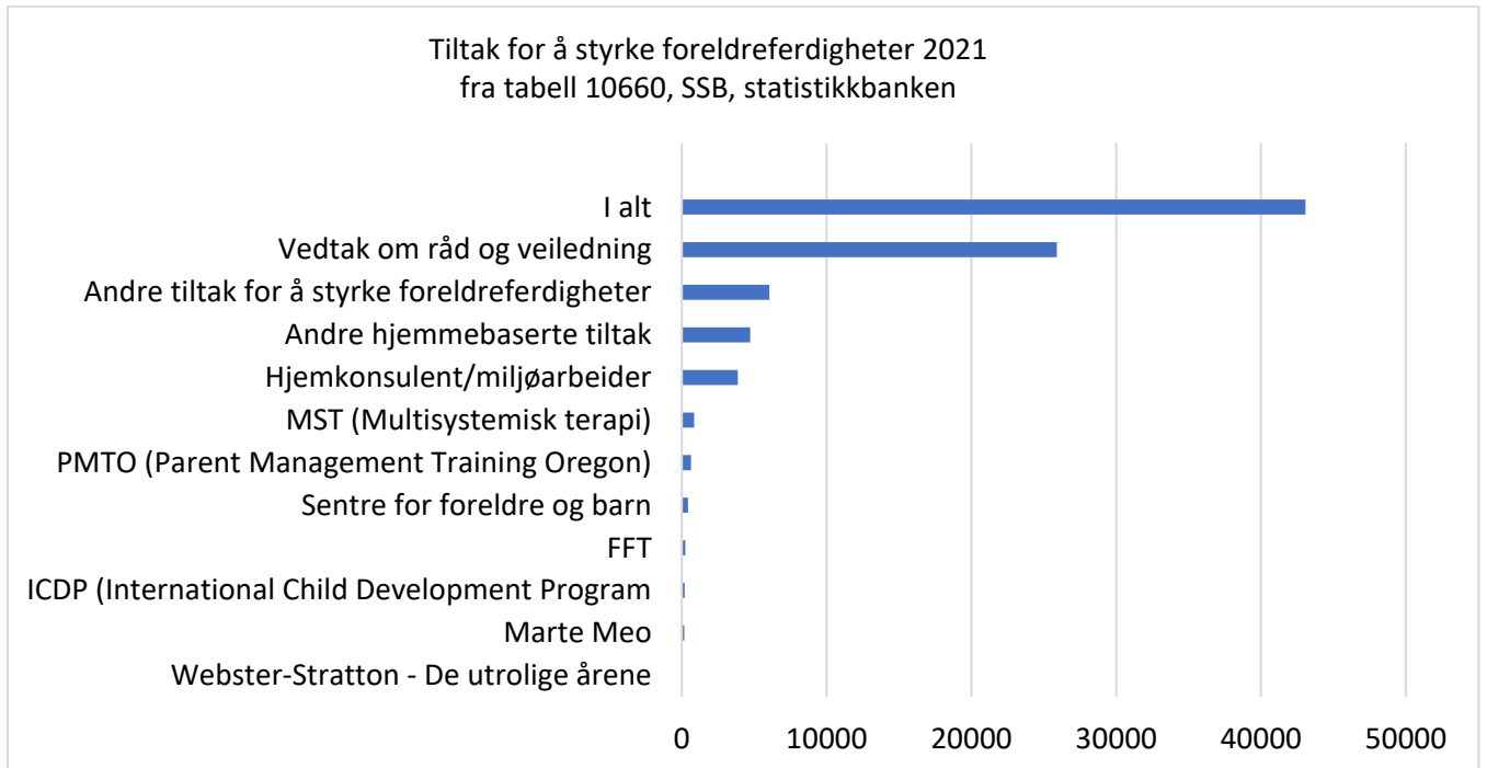
Figur 1 Oversikt over bruk av tiltak for å styrke foreldreferdigheter i 2021.

derfor ikke registrert omfang av bruk av COS-P. De tiltakene som det er registrert omfang av fremgår av figur 1.