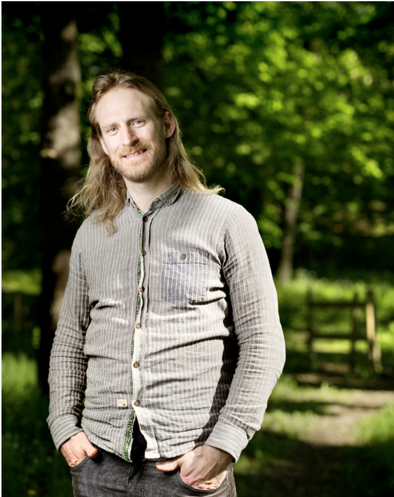
WALGERMO: Nokre gongar går forfattaren rett frå å seie at bibelteksta kan forståast på ulike måtar, men heilt utan argumentasjon går han vidare som om den han sjølv vel, er den einaste som duger, skriv Rolf Kjøde.