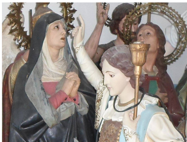
San Lazaró-Babalú-Ayé Boveda med 7 vannglass