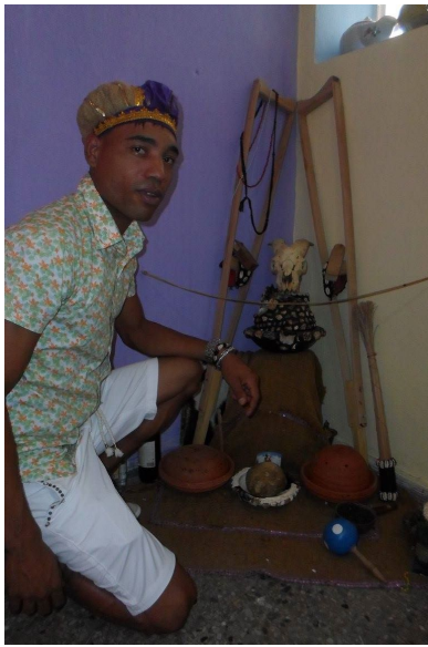
Santero, Centro Havana