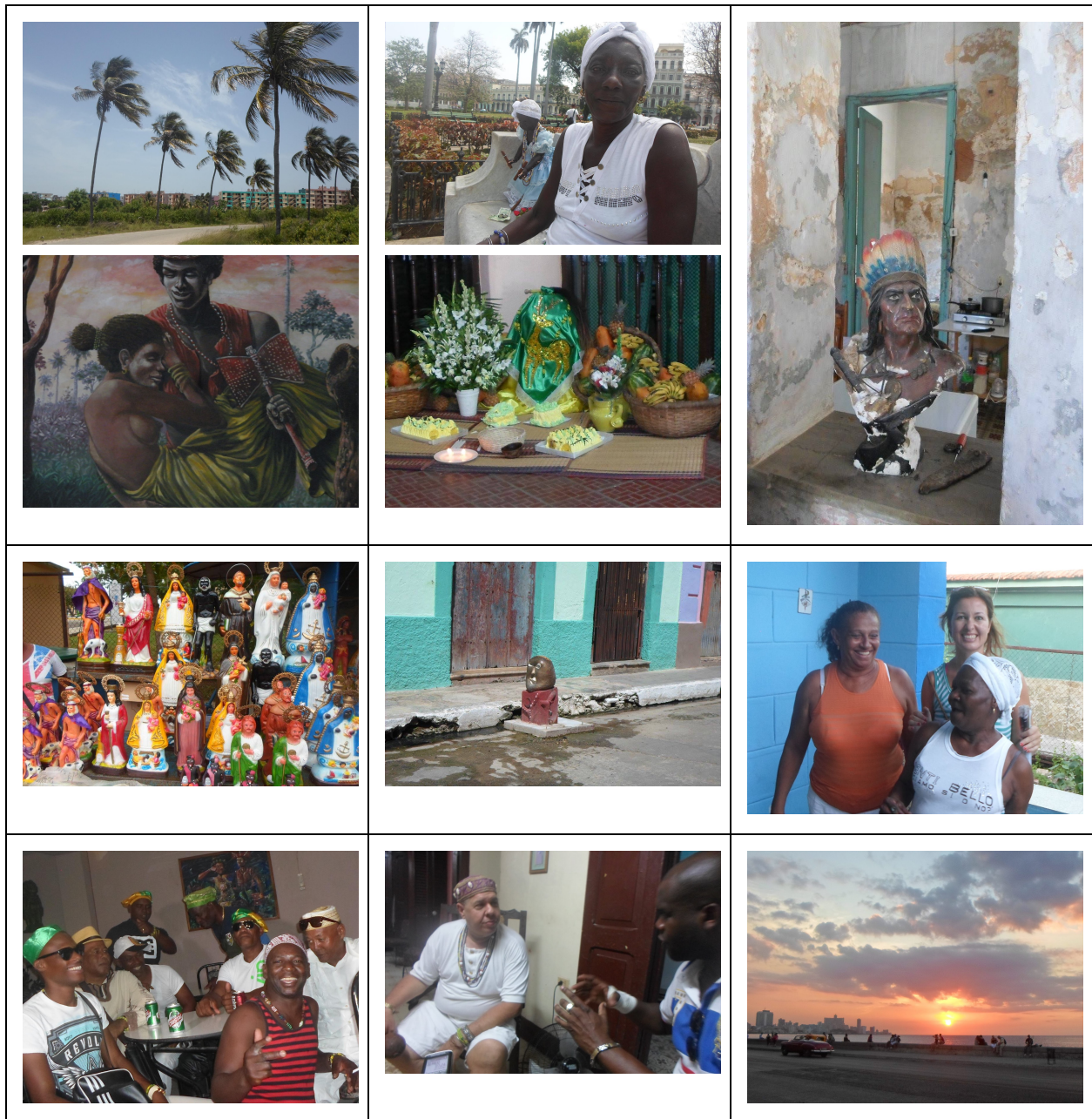
Fra øverst: Alamar, spiritist i parken La Fraternidad, Shangó/Uchún bilde i Asociación de Yoruba, Offeralter for Orúla, indiansk guide, Elleguá i gate i Cardeñas, meg på cajon, babalawos i A. de Yoruba, babalawo i samtale med Victor, Malecon i solnedgang.

Fra mitt arkiv "La vida espiritual", La Habana 2014-16.