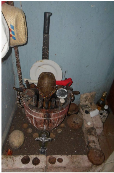
Nganga i paleros hus