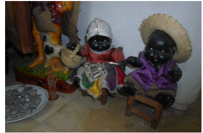
Orishas i paleros hus.