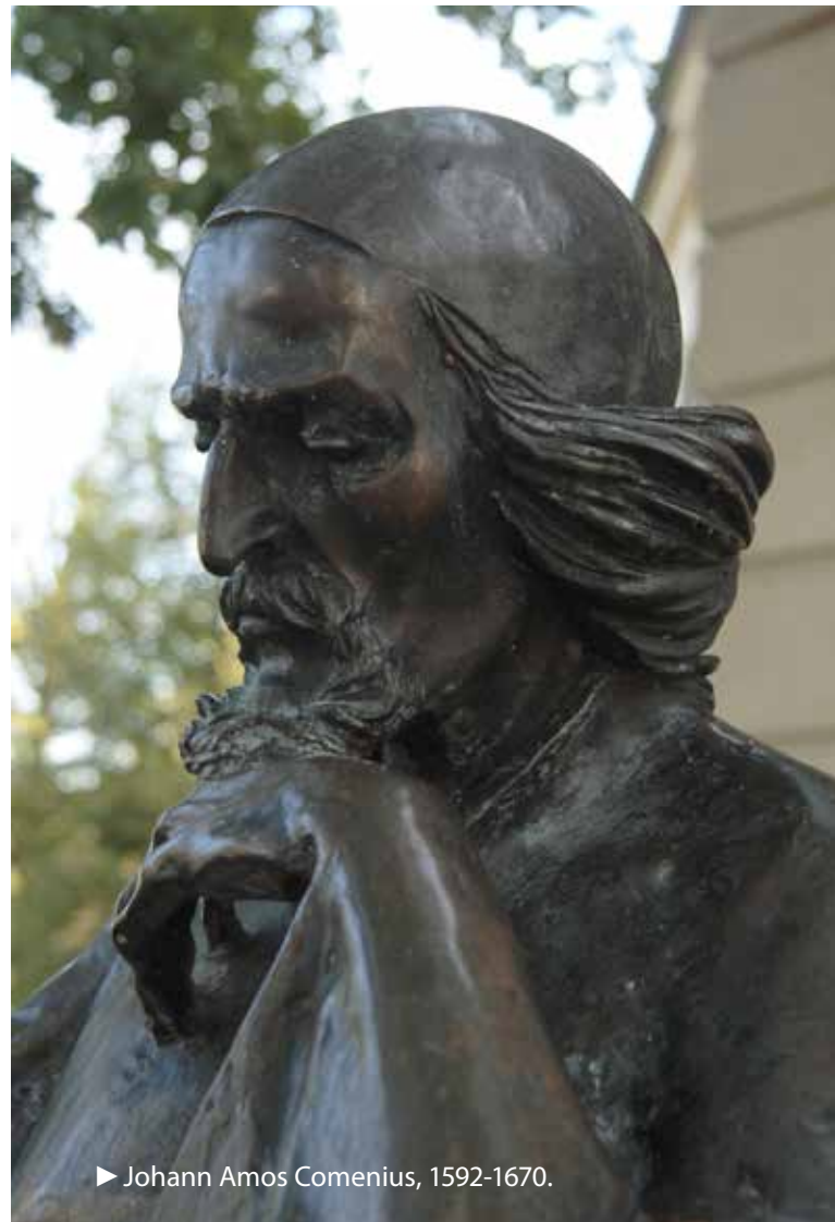
► Johann Amos Comenius, 1592-1670.