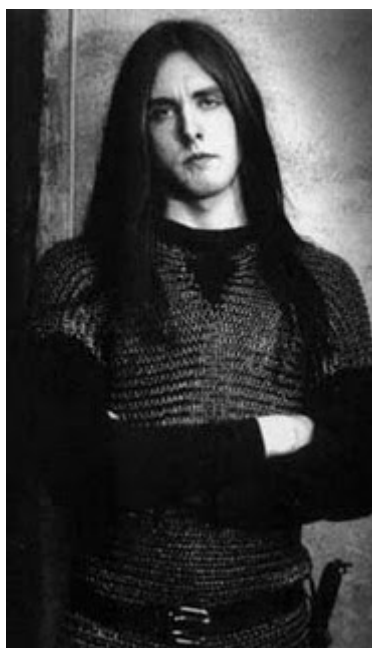
Illustrasjon 8: Bildet er fra tidlig nittitalt og viser en ung Varg Vikernes - kledd for kamp?

Igjen kan det være hensiktsmessig å ta et sideblikk på hvilken kontekst teksten ble skapt i, og undersøke hvordan forfatterens samtid kan ha spilt inn. I den tidlige fasen 131 av norsk black metal var det nemlig et stort fokus blant band og tilhørere på fortiden og det de anså som fortidens idealer. 132 Ideene om disse idealene spente seg fra en voldsromantisk hyllest av det krigerske og det maskuline til forestillinger om djeveldyrkelse 133 og en tid da magi, guder, vetter og troll fremdeles var en del av virkeligheten.