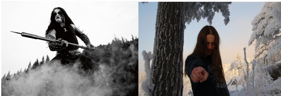
Illustrasjon 22: Til venstre Abbath fra Immortal, til høyre Fenriz. Avbildet skogen.

Bildet til venstre viser vokalisten og gitaristen i det norske bandet Immortal. Norsk og nordisk natur har lenge vært sentralt i bandets tekstlige og visuelle uttrykk, og det er tydeligvis herfra tekstforfatteren og bandet henter inspirasjon. 284