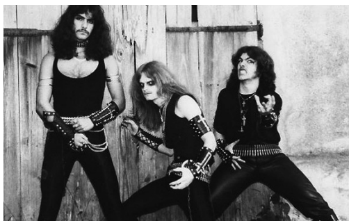
Illustrasjon 3: Sveitsiske Celtic Frost. Legg merke til bruken av mørk sminke rundt øynene og nagler, noe som senere skulle utvikles av andre generasjons black metal band.

Image og musikkstil ble adoptert av den unge Thomas Forsberg i Sverige, som tok