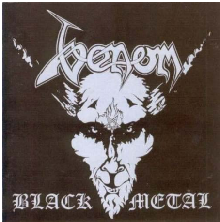
Illustrasjon 2: Front-coveret til Venoms album fra 1982.

Black metal som begrep dukket først opp med Newcastle-gruppen Venoms utgivelse ” Black Metal ” i 1982 8 . Bandets musikk kan beskrives som en blanding av punkrock og heavy metal, og er noe helt annet enn den musikken man i dag forbinder med stilarten. Venom plasseres vanligvis i det man kaller New Wave Of British Heavy Metal-tradisjonen , som inkluderer band som Iron Maiden, Saxon og Mötörhead. 9 Bandets tekster er fulle av sataniske og okkulte referanser, 10 men bandet har alltid forholdt seg til slike temaer på en lite seriøs og til