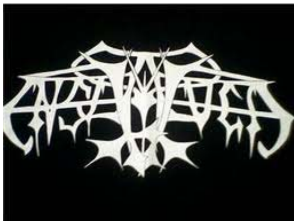
Illustrasjon 6: Farget av sin samtid og sjangertilhørighet? Tidlig Enslaved logo, der de inverterte korsene som er typiske for black metal er inkorporert i logoen.

Kanskje er det nettopp dette som er tilfellet dersom vi tar i betraktning at jotunblodet i teksten forbindes med det onde. Eksempelvis har Enslaveds ene gitarist og forfatter av teksten selv uttalt at han ønsker å " ta med de originale verdiene, de ekte, de gode verdiene fra det norrøne, fra den hedenske fortiden, og skape noe nytt ". 108 Det er ikke et ønske om å