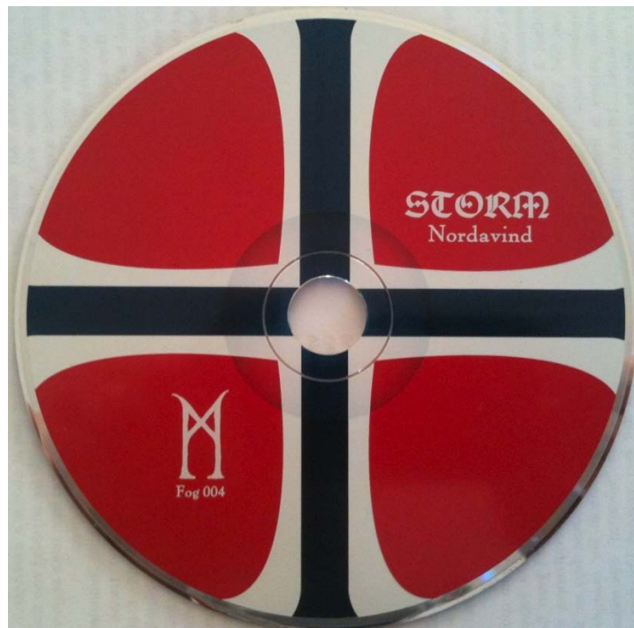
Illustrasjon 11: Bildet viser cd'en til Storms utgivelse "Nordavind". Trykket er i det norske flaggets farger, og er