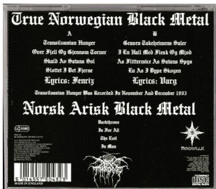
Illustrasjon 9: Baksiden av coveret til "Transilvanian Hunger", preget av "True Norwegian Black Metal" og "Norsk Arisk Black Metal"

Mindre forvirrende blir det ikke av at det på "Transilvanian Hungers" bakside-cover står å lese "Norsk Arisk Black Metal". Riktignok vil det å definere noe som å være arisk i seg selv kunne oppfattes som å være ekskluderende. I tillegg til de historiske og politiske konnotasjoner begrepet måtte ha, sier det uansett en del om hva det ikke er. På den andre siden tas det likevel i bruk en betegnelse man (blant flere andre assosiasjoner) vanligvis også