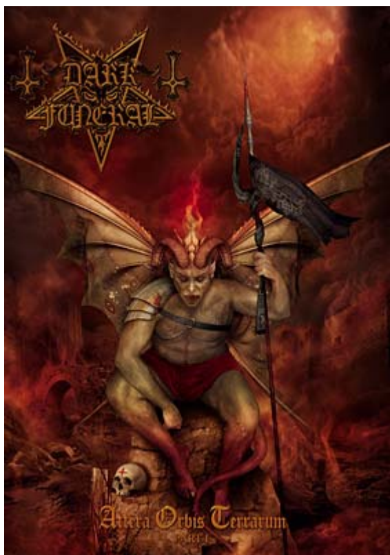
Illustrasjon 16: En av Dark Funerals mange dramatiske bilder, som viser en personifisert Satan-skikkelse, sittende på sin trone i helvete.

fysisksted , og ikke bare en tilstand. Dette ligger ” far beyond the realms where no more light shines ”, der Satan sitter på sin trone, mellom ” regions of evil ”, porter og flammer. På denne måten formidler teksten til meg som leser at helvete har en slags ”metafysisk geografi”, og disse beskrivelsene bygger dessuten opp om en forståelse om at djevelen og hans domene har en virkelig eksistens , kontra det å være symbolske metaforer.