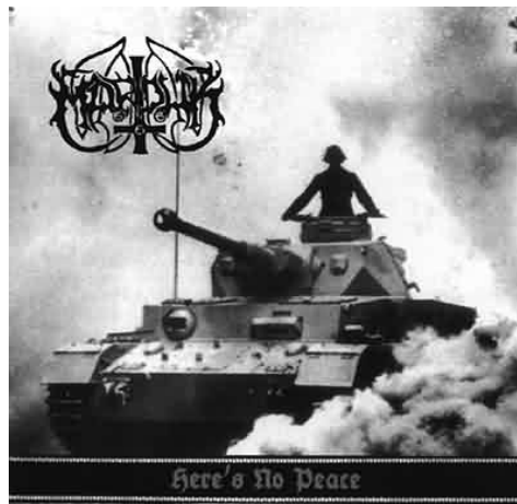
Illustration 21: Samme budskap men i en mer moderne drakt? Bildet viser frontcoveret til Marduks EP "Here's No Peace", og kan være et uttrykk for krigen som symbol for Satans kraft

kan være noe av årsaken til at mange utgivelser har en krigsforherligende estetikk, i tillegg til at musikere i rustning med våpen er et yndet fotomotiv. Dessuten kan krig, på grunn av all lidelse og ødeleggelse den medfører, ses på som Satans verk, og som et kraftig symbol mot