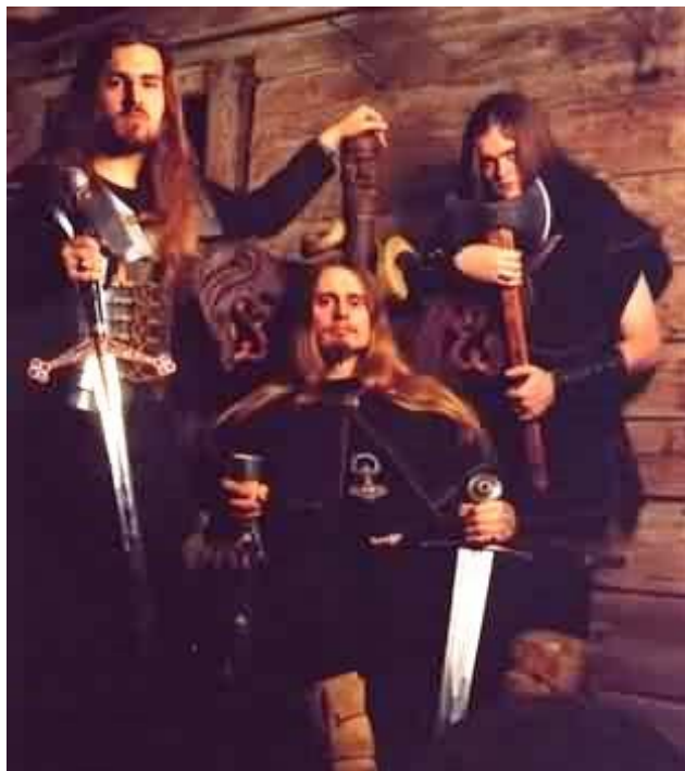
Illustrasjon 5: Enslaved slik de fremstår i platecoveret til utgivelsen "Eld"