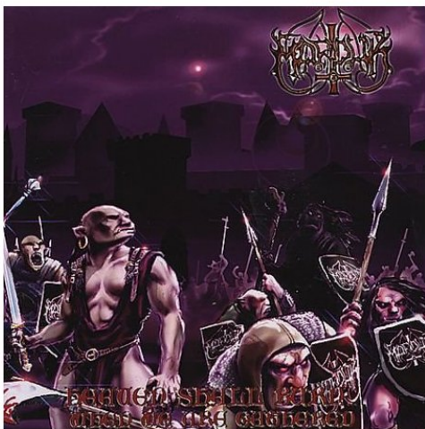
Illustrasjon 20: Frontcoveret til Marduks album "Heaven shall burn...When we are gathered" viser en marsjerende armé av demoner og skrømt, rustet til kamp mot det gode.

Til forskjell fra inspirasjonskildene er det i black metal tekstene ikke det gode som seirer, men djevelen og de som står på hans side – resultatet blir altså snudd på hodet; fra den seirende Kristus til den seirende Satan. At denne forestillingen er så sentral 259