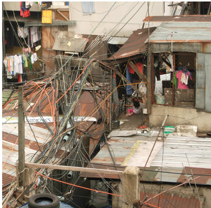
2008, Manila