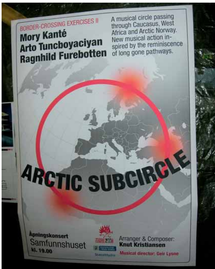
Kulturlivet set Kirkenes på kartet på nye måtar. Konsertplakat for Musikkprosjektet «Arctic Subcircle» under Barents Spektakel 2008.

I mange kommunar snakkar man om at det er viktig «å sette staden på kartet». I Kirkenes skjer dette nokså bokstavleg i kulturlivet ved at kart og kartsymbolikk stadig blir brukt, og ved at kulturen, som i dette eksemplet, blir brukt til å nyteikne kartet og vise nye globale samanhengar der Kirkenes og den arktiske sona får eit anna fokus. 20