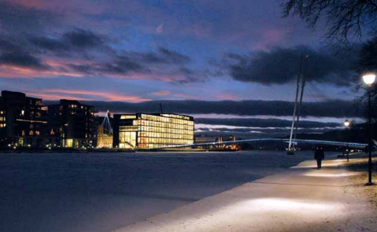
Ypsilon og Papirbredden, med Union Scene i bakgrunnen i dag.

gruppa. 59 Av dei 11 624 som ifølgje Statistisk sentralbyrå tilhørde innvandrarbefolkninga i Drammen per 1. januar 2008, kom 2091 frå Tyrkia. Tala for dei to nest største gruppene var 869 frå Pakistan og 866 frå Irak.