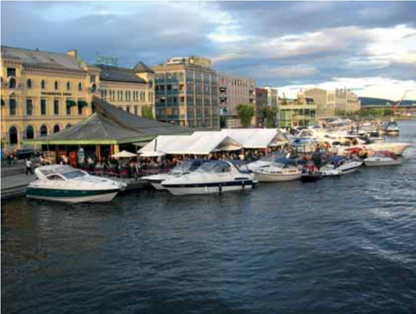
Båtliv, restaurantliv og gateliv under Elvefestivalen i Drammen. Foto: Olaf Aagedal

Storås, men skilnaden er at der er det bygda sitt engasjement og sin medverknad i skapinga av ein ny og stor festival som skal vere det identitetsbyggande, medan det i Drammen er drammensarane si publikumsoppleving av staden og byfelleskapet som blir fokusert. Som i Storås blir også festivalen sin økonomiske betydning i forhold til næringsliv og omsetning vektlagt, men sidan Elvefestivalen primært er ein fest i byen for byen, er imagebygging-diskursen mindre tydeleg her. Derimot blir det skreve mykje om korleis omsetninga og utelivet blømer under festivalen. Det blir sett rekord i skjenkestader, og det blir sagt at desse dagane er blitt større enn 17. mai når det gjeld folk på byen. Elvefestivalen har også eit uttalt underholdningsrationale : «Byen fylles av kultur og underholdning, kunstarrangementer, tivoli og spisesteder trekker folk ut i gatene.» 190