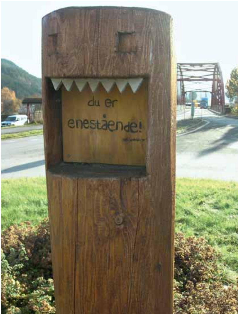
Monument i Meldal over «bygdedyret».

Dugnaden på Storås er også det ein mann i nabobygda kallar «bondeapparatet» – tilgang på traktorar og utstyr.