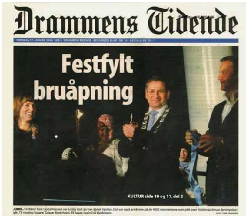
Frå opninga av Ypsilon.

Medan publikum ventar, blir det gitt instruksar om korleis opninga skal gå føre seg. Publikum skal få oppleve fyrverkeri på elva – så storslått som ein aldri før har sett det i Drammen, blir det fortalt. I 90 sekund skal Drammen få høve til å vise seg frå si beste side direkte i ei sending på TV 2. Bakgrunnen