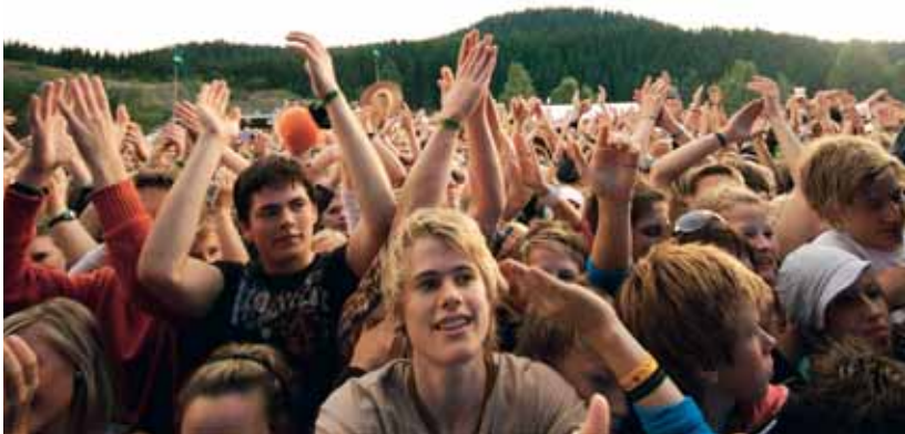
Storås som vegkryss eller stad for store massar?

tyding kan festivalen og sjåast som ei oppdaging og symbolsk gjenoppliving av ein stad som har vore prega av moderniseringas fråflytting og arbeidsløyse – ei form for fortrylling av det avidylliserte bygdesamfunnet.