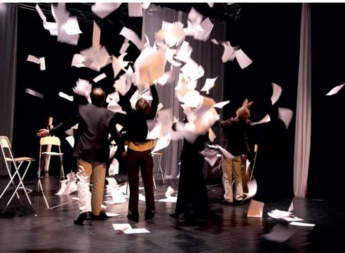
Samovarteateret si handsaming av Nordområdemeldinga i framsyninga «Voices». Frå Barents Spektakel 2008.