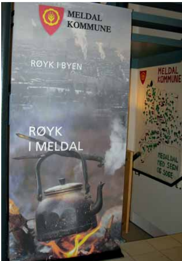
Myteskaping om bygda. Plakat i Meldal kommunehus.

Det øvste motivet er kommunevåpenet med teksten «Meldal kommune». Motivet i bakgrunnen på plakaten viser fabrikkpiper med røyk og har teksten «Røyk i byen». Motivet i front viser ein kaffikjele over eit bål der røyk og damp stig opp frå bålet og kaffikjelen med teksten «Røyk i Meldal». Sams for dei to siste motiva er at dei begge både i tekst og bilete refererer til same konkrete fenomen: røyk (denotasjon). «Røyk» er eit ord som kan skape mange ulike assosiasjonar (konnotasjonar). At uttrykk er fleirtydige og får ei varierende meinig i ulike kontekstar, er ikkje det same