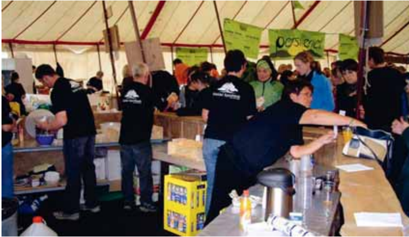
Frivillige bygg festivalen. Storåsfestivalen 2007.

Festivalen blir frå første år godt motteken og dels ekstatisk skildra i lokal- og regionavisene, både for sitt musikalske og utanommusikalske program. Dette vert oppfølgt av artiklar om storåsbygg som skal delta i Gåte sin kommande video, om å vere stolt av å komme frå Storås og kjenne seg som storåsbygg, om tradisjonsmat som kan vere moderne, om vegkrysset som er blitt sett på kartet, om ungdom som er meir positive til å busette seg, om festivalen som har snudd opp ned på førestellingane om byfolk og bygdefolk. Festivalen får etter kvart godkjent også i riksmidia, og etablerer seg som den hippe musikkfestivalen på bygda som foreinar det rurale med det urbane (jf. Hjelseth & Storstad 2008).