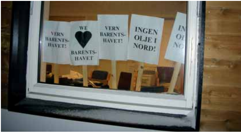
Plakatar frå Natur og Ungdom sin demonstrasjon under Barents Spektakel 2008.

Dei «nye kulturaktørane» har tematisert og kommentert nokre av desse spørsmåla gjennom debattmøte og «performances». Men det verkar ikkje som dei representerer ein protestkultur i desse spørsmåla, slik dei til dømes gjer det med omsyn til grensekontrollen. Dette gjeld i alle høve om ein legg 70-talet sine målestokkar for samfunnskritisk kunst til grunn. Men her kan det vere at noko av forklaringa nettopp ligg i at postmoderne konseptkunst har andre førestellingar om forholdet mellom politikk og kunst og ønskjer å vere politisk på andre måtar. Kulturforskar Ellen Aslaksen har intervjuet «konseptkunstnere» som kommenterer denne forskjellen (Aslaksen 2004:57):