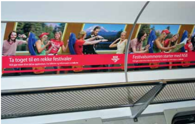
Kulturreklame frå NSB sommaren 2007.

Den nye interessa for kultur er ikkje isolert til lokalt kulturliv. Fleire forskarar hevdar at vi i dag også regionalt, nasjonalt og internasjonalt opplever ei auka merksemd rundt og satsing på kultur. Det ytrar seg både gjennom at ein «tenkjer kultur» inn i fleire nye samanhengar og trur på kultursatsing som eit svar på mange ulike spørsmål og utfordringar i samtida, og at ein «handlar kultur» ved å satse på kulturnæring, utvikle nye kulturinstitusjonar og bygge ulike former for kulturbygg. Forskarar har omtalt denne trenden som kulturalisering (Fornäs et al. 2007). Relatert til vårt temafelt kan vi seie at eit viktig perspektiv i denne boka er å analysere i kva grad og på kva måte det i norske lokalsamfunn i dag skjer ei «kulturalisering».