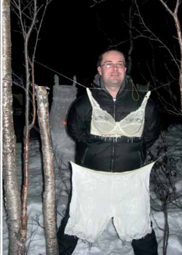
Arktisk samtidskunst. Frosne klede i interaksjon med publikum. Pikevann ved norsk-russisk grense 2.02.2009.

Saman med resten av publikum lagar eg meg ein sitjeplass i den snodekte skråninga ned mot vatnet. På isen er dei siste førebuingar til framsyninga i gang. Scenografien består mellom anna av isskulpturar og frosne klede. På isflata går det ei lysstripe av faklar som er frosne ned i isen. Elles ser eg eit par regitårn for lyd og lys. Langt ute på vatnet kan ein sjå lyset frå eit bål, og på ein fjelltopp like ved brenn eit bål som gir assosiasjonar til ein varde. Nokre snøscooterar suser fram og tilbake mellom båla og sceneinstallasjonen på vatnet. Nokre hundre meter unna kan ein sjå lysa frå riksvegen og grensestasjonen på Storskog.