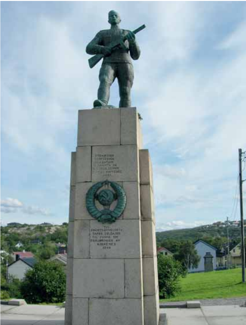
Russemonumentet i Kirkenes.

til ei interesse for menneska i flya og deira lagnad, og til eit mangeårig engasjement og samarbeid med Russland for å få identifisert dei falne og gjeve dei ei verdig gravferd 60 år seinare. 29