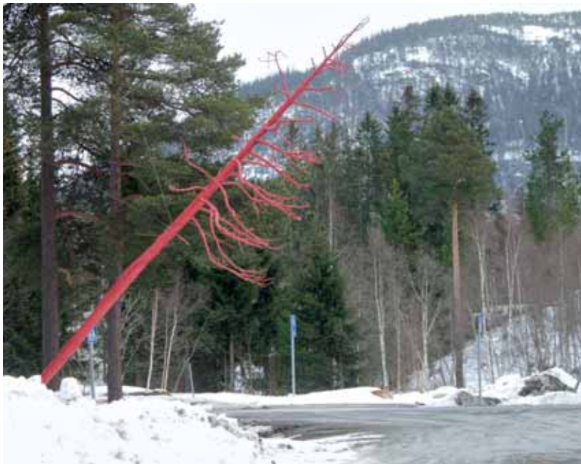
Festivalen bryt med det kjente. Inngang til festivalområdet.

Det tilsynelatande oversiktelege og alle-kjenner-alle eksisterer ikkje. 153 Ein huseigar i nærleiken av festivalområdet blei i løpet av festivalnattas