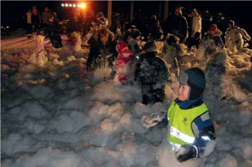
Lokal vinterdramaturgi. Frå La Compagnie Malabar si opning av Barents Spektakel 2008.