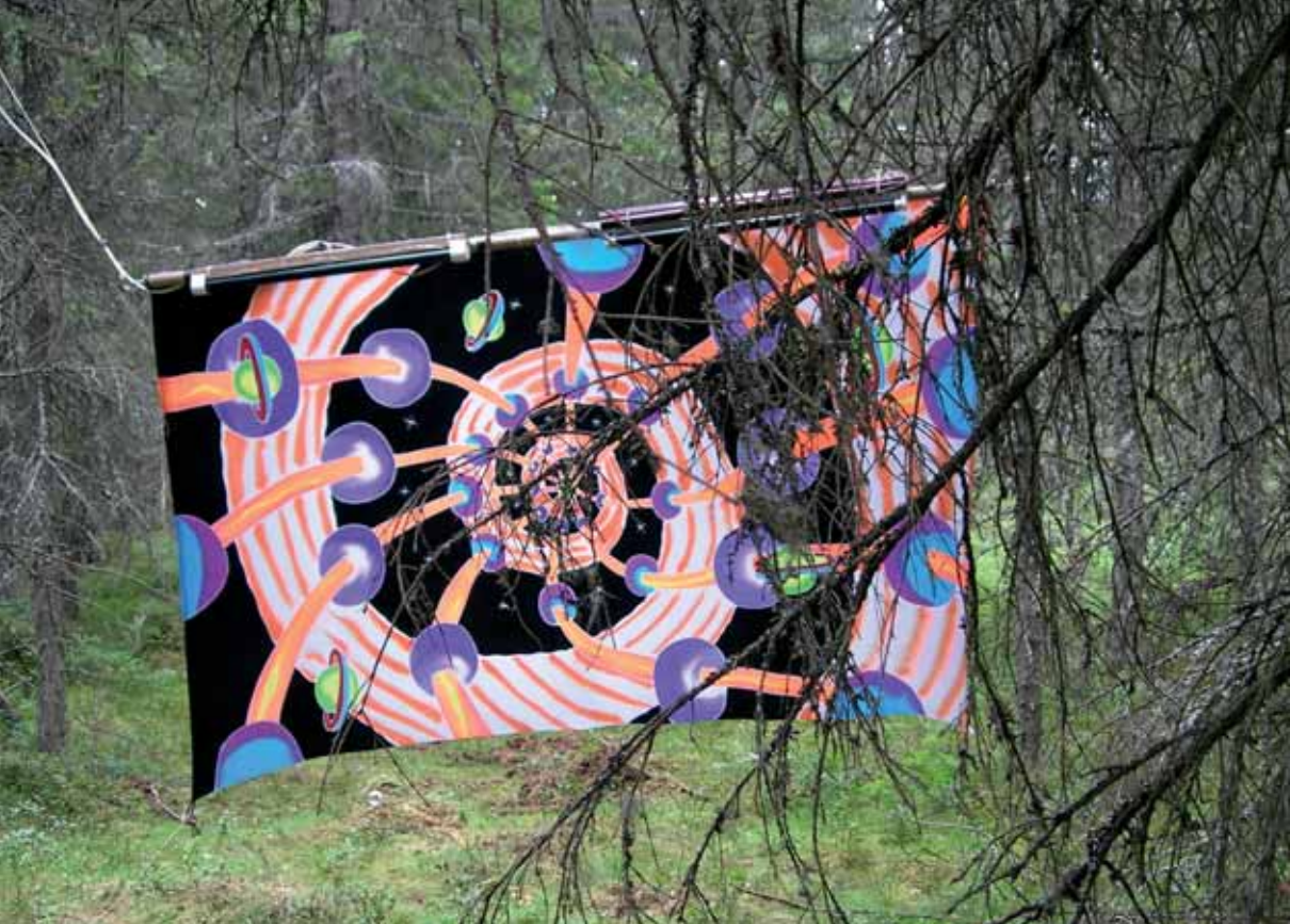
Fortrylling av skogen under Storåsfestivalen.