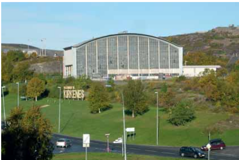
Lokhallen i Kirkenes. Frå industrilokale til kulturarena – og tilbake til industribygg.