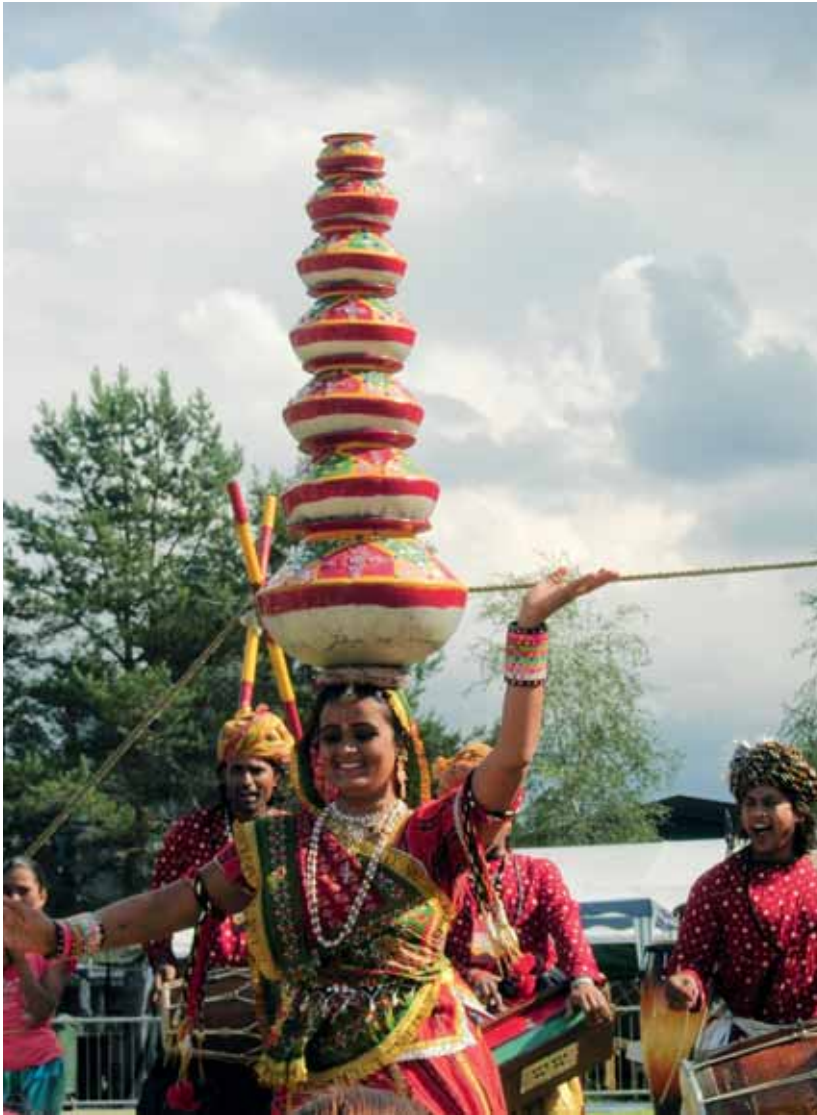
Sirkus på festival. Storåsfestivalen 2008.

Festivalen er eit lokalt kulturarrangement i den forstand at det er tungt forankra i lokalsamfunnet, med arrangørar, personell, investorar og nøkkelpersonar. Festivalen si betydning for lokalt kulturliv er belyst gjennom forteljingane og opplevingane til ulike aktørar, og berører fleire kulturområde og satsingar i kommunen, til dømes omdømmearbeid, skulepolitikk, kulturskule, kulturpris og planarbeid. Den store hovudforteljinga om fes-