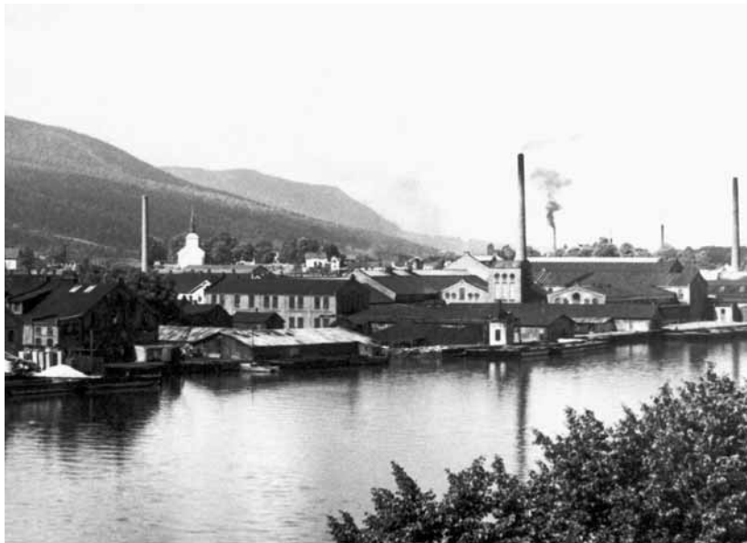
Grønland 1920.

Drammen ligg i Buskerud fylke, inst i Drammensfjorden, 42 km vest for Oslo. Byen blei grunnlagd i 1811, då kjøpstadene Strømsø og Bragernes, den eine på sørsida og den andre på nordsida av Drammenselva, blei slått saman til éin kjøpstad som fekk namnet Drammen. Namnet Drammen kjem truleg frå norrønt og kan avleias av « drafi », 'grums, smått avfall', og samme ord som drofn i norrøn poesi, 'bølge'; navnet Drammen kan da bety 'den bølgende' eller 'den som har uklart vann'. 55 Som administrasjonssenter for Buskerud fylkeskommune har Drammen ein sentral posisjon i regionen.