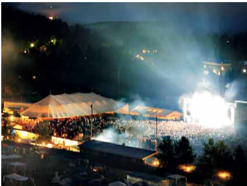
Magi på Storås. Madrugadakonsert 2005.

Det at dei har lagt det til siste helga i juli det er litt spesielt det og sant, har noko med lyset å gjere, har med stemninga å gjere i det hele tatt. Det har og litt utslag at eg hugsar når Gåte var her – då var eg på tur heim, og gjekk opp bakkane oppå her – og såg inn i scena her når Gåte ... og hørte ho Gunnhild Sundli sang – ja det var heilt – då høyrtest det utover heile Storås. Det var ganske fantastisk, ja. Og det var stappfullt av folk.