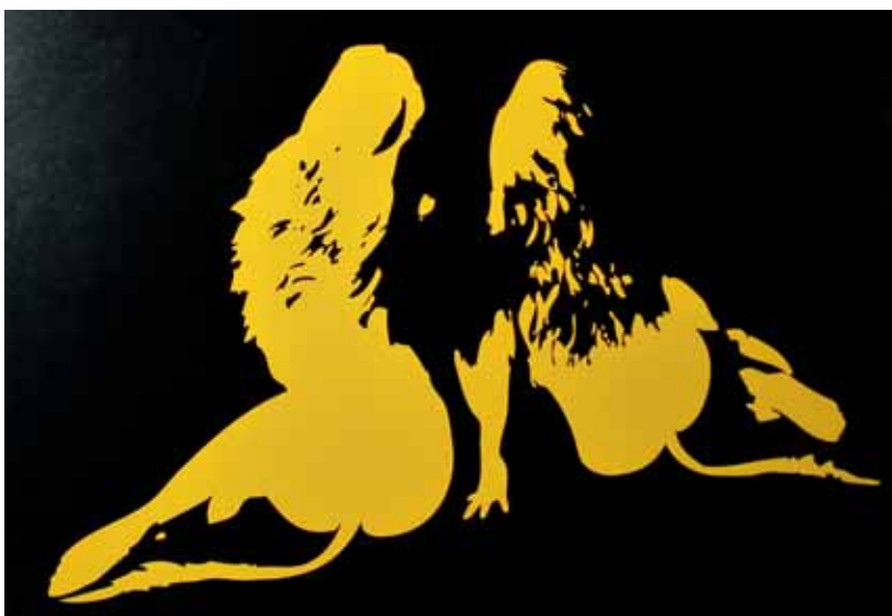
Huldrene. Storåsfestivalen sin offisielle logo

«Vi holder til midt i skogen», seier presentasjonen på Storåsfestivalen si heimeside 2009. Natur- og skogs-metaforikk har ein sentral plass i omtalen og gjennomføringa av festivalen. «Meldal er også omringet av en fantastisk natur, med lakselva Orkla rennende igjennom hele kommunen, samt massive Trollheimen som både er gjenstand for jakt og stille turisme, samt mange sagn og myter.» Metaforisk bruk av skogen og ulike former for skogsmystikk gjennomsyrrar festivalen. Festivalen sin offisielle logo er to mytiske skogsvesen: dei to huldrene som går igjen på festivalmateriellet, og er eit eksklusivt tatoveringssymbol. Dei gjev også namn til ei av festivalscenene: «Huldrascenen». I matteltet kan ein kjøpe «elgburger», og blir ein tørst, kan ein gå i «Gran Bar» eller «Gåte Bar».