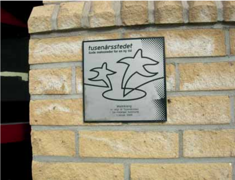
Malmklang som tusenårsstad og symbol på «det gode kulturlivet».

aktørar som føler dei blei inspirerte av å jobbe i huset, og det gjeld publikum som seier at det skjedde noko med ein når ein kom inn der. Den spesielle Malmklang-atmosfæren eller Malmklang-magien gjorde huset til eit lokalt kultursymbol, noko også statusen som tusenårsstad er uttrykk for. Mange har også lagt vekk på huset si tyding som storstove og møteplass og brubyggjar mellom ulike fasar og delar av kulturlivet, eksemplifisert ved at både det profesjonelle teateret og revygruppa hadde tilhald der. Primus motor i revyarbeidet omtalar huset som eit samlingspunkt: «Du traff alltid nokon der som ikkje hadde noko med ditt å gjere.»