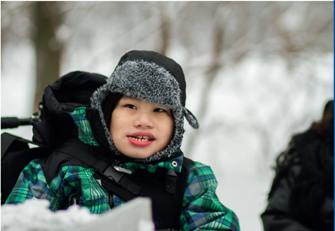
Illustrasjonsfoto: Mikkel Eknes.