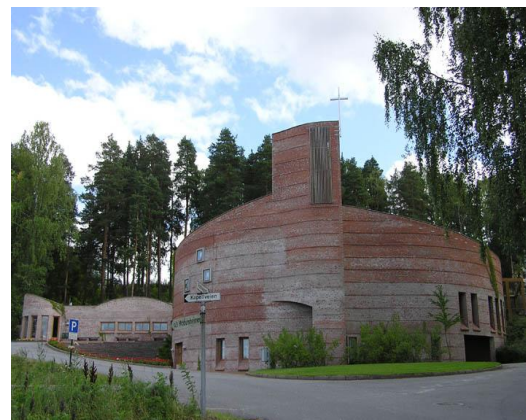
Åmot kyrkje, Modum