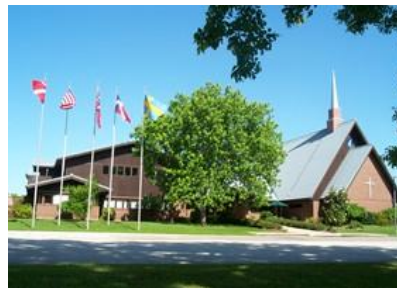
The Norwegian Church Abroad in Houston, USA, is one of 32 churches around the world.

The Norwegian churches abroad and travelling chaplains have an international network of social meeting places where seafarers, students, business people, tourists, families and other travelling Norwegians can come "home" for a while. Today, the churches and their staff together with travelling pastors around the globe represent a "resource center" for all Norwegians travelling internationally.