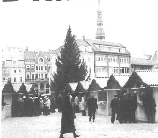
Julemarkedet i Riga er både aktivt og populært blant folk flest.

Riga: Etter første kontakt høsten 1992, med påfølgende diakonikonferanse i 1993, ble det i 1994 etablert en partnerskapsavtale mellom Den Evangelisk Lutherske kirke i Latvia (ELCL), Den Nord-elbiske kirke og en gruppe i Norge bestående av Diakonhjemmets teologiske høgskole, Norsk Diakonihøgskole Lovisenberg og Det Norske Diakonforbund (Latvia-gruppen). I 1997 kom Lutherhjelpen fra Sverige inn. For Latviagruppen har dette vært et prosjekt «Diakoni i Latvia».