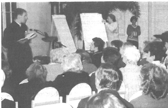
Framlegging av gruppearbeid

Jesu oppfordring om å være «lys og salt i verden» gjør stadig knoppkytting. Hvordan diakonien utvikler seg i Den Evangelisk Lutherske kirke i Latvia er til stor inspirasjon.