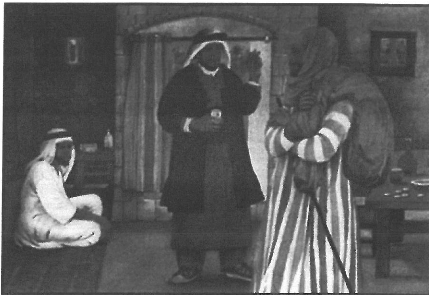
Flere gode gjerninger? Samaritanen følger opp sin serie med gode gjerninger.

Selve sentrum i Guds forsyn er imidlertid Jesus. På en særlig måte er han Guds gode gjerning midt i vår verden. “Han gikk omkring overalt og gjorde godt”, sies det om ham i Apostlenes gjerninger (10,38). Selv sa han: “De gjerninger jeg gjør, vitner om at Faderen har sendt meg” (Joh 5,36). I ham og hans gode gjerning for oss ser kristentroen veien, sannheten og livet (Joh 14,6), tolkningsnøkkelen for den dypeste mening og normen for all god gjerning.