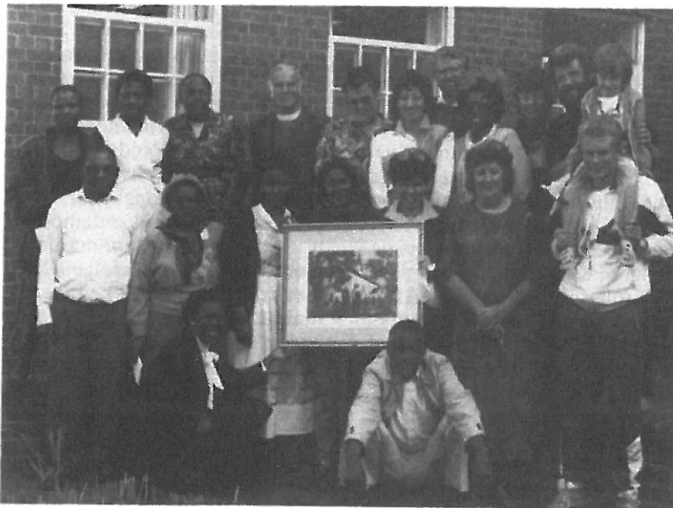
Deler av staben ved DIAKONIA fotografert sammen med norsk gjesteinnslag.

tiske problemer som for noen få år siden. Idag er det de politiske partier og grupperingers oppgave å arbeide for å finne politiske løsninger. Kirkens hovedoppgave er å påpeke, er å være kritisk. Og dette kritiske blikk skal Kirken ha mot alle slags politiske grupperinger. Om vi så skulle få en ny regjering der