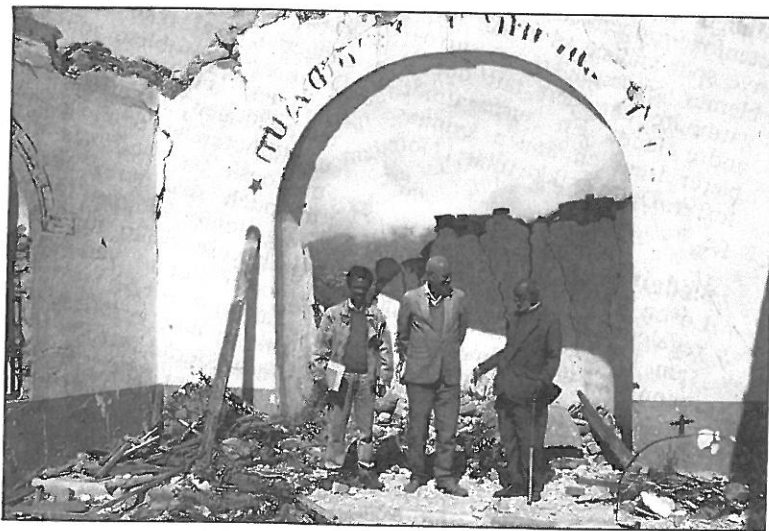
Menigheten i Geleb vil gjerne bygge ny kirke, men trenger økonomisk støtte til å gjennomføre prosjektet.

Landet bar preg av massiv bombing og ødeleggelser, vold og drap mot befolkningen. Økonomien var elendig, infrastrukturen dårlig og skole- og helsevesen må bygges fra grunnen. Til tross for disse forholdene møtte vi et folk med en livsglede og optimisme som kunne smelte et norsk stenhjerte. Strålende barnøyne, vennlige og omtenk-somme folk overalt. Vi opplevde eritreerne som stolte, høyreiste mennesker som utstrålte en indre styrke.