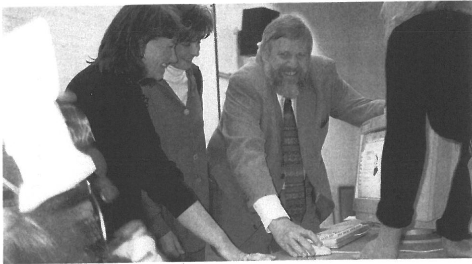
Det nye Internettbaserte studiet åpner muligheten for nye steder og for nye grupper, påpekte undervisningsminister Jon Lilletun under semesteråpningen i november i fjor.