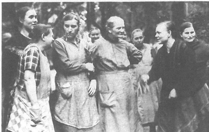
Pasienter ved Indremisjonens kvinneanstalt, Gross-Bethel.

I en ny steriliseringslov som trådte i kraft i januar 1934, ble det åpnet for sterilisering med tvang. Dette slo hull i det viktige forbeholdet om frivillighet. Men også her skulle statslojaliteten vise seg å veie tyngre for Die Innere Mission enn de etiske motforestillingene. De la seg på en linje som i praksis viste aksept for den nye loven og dens program. Allerede høsten før, i 1933, hadde Indremisjonen omdøpt sitt faste fagutvalg på området til det programmatisk Ständiger Ausschuss für Fragen der Rassenhygiene und Rassenpflege (Det faste utvalg for spørsmål angående rasehygiene og rasepleie).