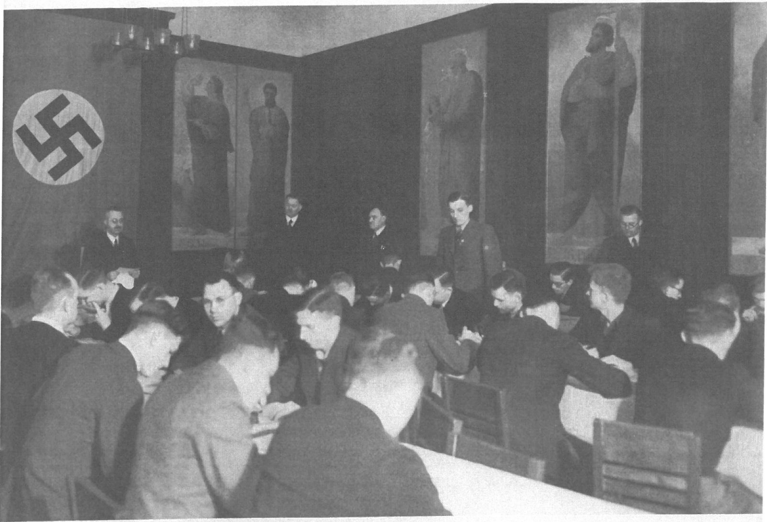
Den bibelske veggpyrden er supplert med et hakekors under denne samlingen for kirkelige tillitsvalgte ved Evang. Johannestift i Berlin i 1938. Johannestift var en av de bruneste diakonale institusjonene i Tyskland på 1930-tallet.

nen skulle til bunns i hvordan det kunne ha seg at deler av misjonens anstalt, Rickling i Kühlen, ble stilt til rådighet for nazister som opprettet en midlertidig konsentrasjonsleir i området i 1933.