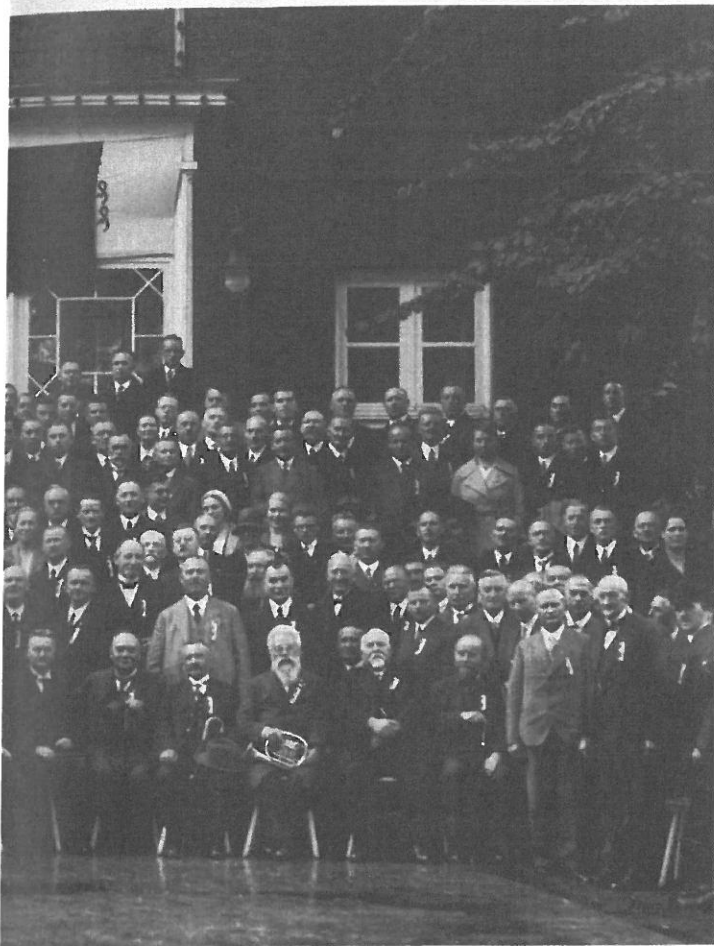
Under nazibanneret i Hamburg, september 1933: Medlemmer av det tyske diakonforbundet - og en rekke andre gjester - er samlet til 100-årsfeiring for den mannlige diakonien i Tyskland.