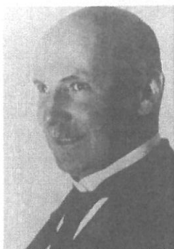
Friedrich von Bodelschwingh

I perioden 1934 til 1939 ble i alt 350 000 mennesker tvangssterilisert i Tyskland, en ikke uvesentlig andel av dem i institusjoner med diakonalt flagg.