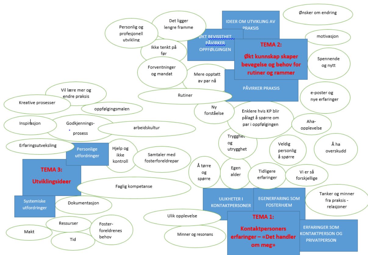
Figur 5. Temakart i fase 4