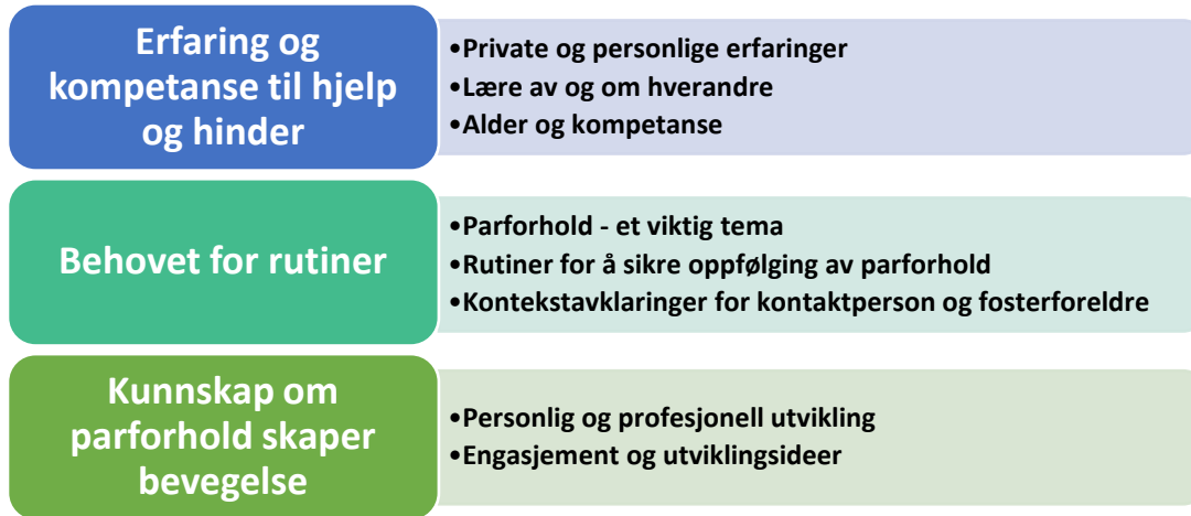
Figur 6. Studiens resultater

En samlet oversikt over temaene jeg har analysert meg fram til ser slik ut: