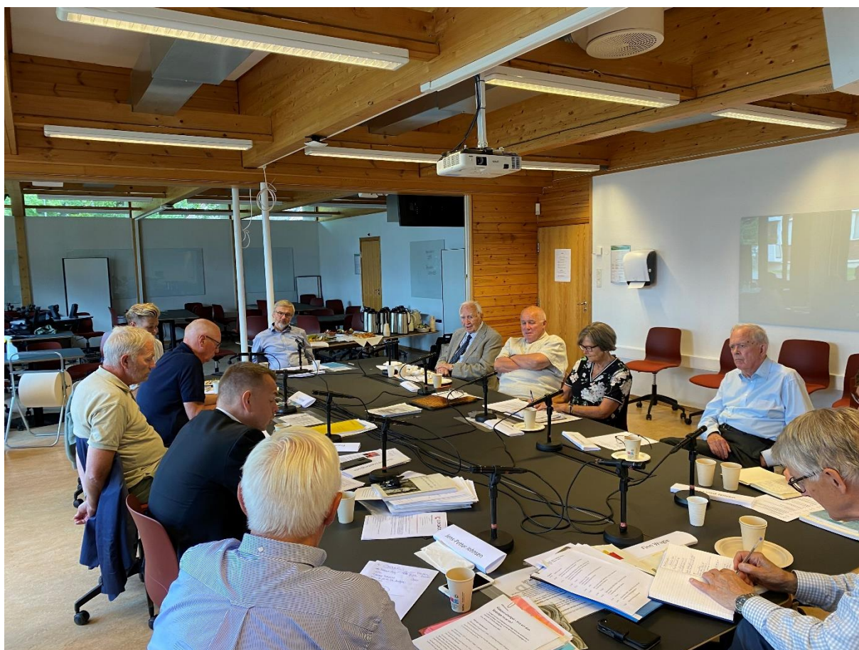
Aktørseminaret ble avholdt på VID vitenskapelige høyskole onsdag 25. august 2021