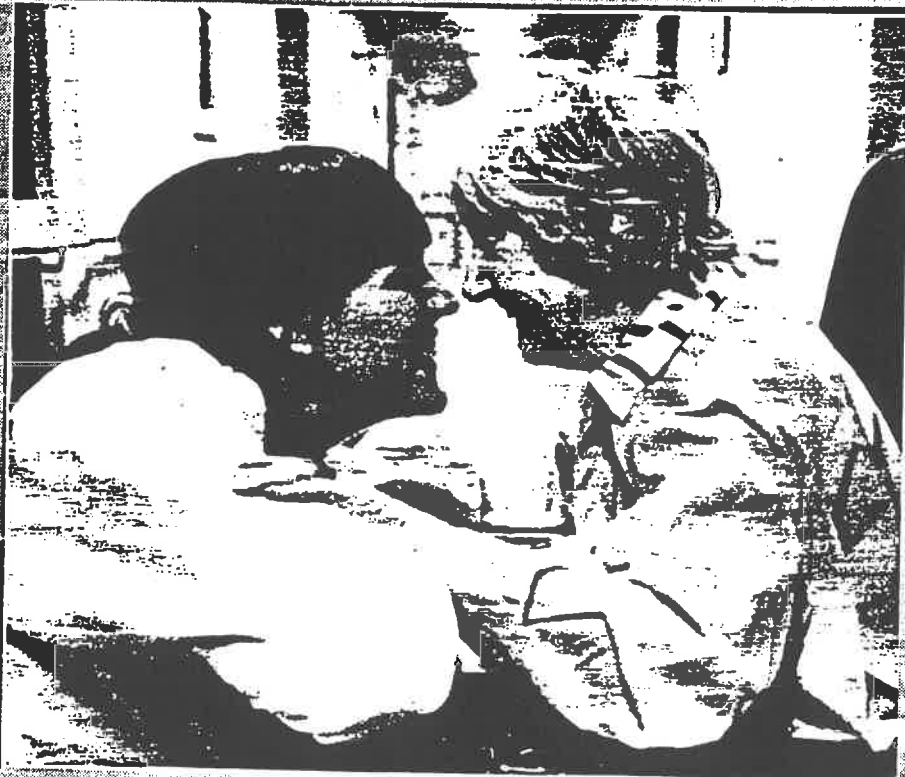
SYKEPLEIEREN I SAMHANDLING MED PASIENTER OG PÅRØRENDE