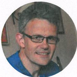
Alder: 51 Yrke: Geriatrisk sykepleier og bokanmelder i Sykepleien

LITTERATUR: Poesi, romaner og fagbøker gir meg stadig inspirasjon i arbeidet med gamle. Trollsang av Odd Børretzen viser på en glimrende måte hvordan det kan oppleves å bli gammel og føle seg utenfor. Romanen Pilatus av Magda Szabó handler om velmenende hjelp fra en datter til en mor i sorg, men uten å spørre hva mor ønsker blir utfallet tragisk. Nå leser jeg Teaching Mindfulness. A Practical Guide for Clinicians and Educators av Donald Mc Cown m fl. Ofte har jeg tenkt på mindfulness som stressmestring og egenutvikling, men er tilnærmingen nyttig i sykepleie til eldre? Boka gir overbevisende svar om at mindfulness kan gi hjelp til å mestre vanskelige livssituasjoner og vonde følelser som ensomhet, tap av mening og sorg. Forfatterne går også i dybden på utøveren som medmenneske i samhandling med de som trenger hjelp, og den er konkret med forslag til praktisk utøvelse. LivBjornhaug.Johansen@sykepleien.no