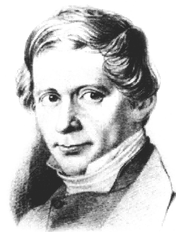
Johann Hinrich Wichern

Det var tysk indremisjon som bar diakonien i Tyskland, og det var den norske indremisjon - Foreningen for indre Mission i Christiania - som ble fødselshjelper for den norske diakonisseanstalten i 1868. Wicherns "Denkschrift" var da godt kjent i Norge. Et nærliggende spørsmål melder seg: hva var kirkens interesse? Å hjelpe den lidende og analysere nøden eller å vise at kirken var en rett kirke, en sann kirke av troende? At kirken trengte diakoni, det lå i hele den politiske situasjonen. Men kirken trengte diakoni for å være en rett kirke, og det syntes å bli det viktigste. Kirken har et kall til å forkynne i kjærlighetshandlinger, ikke bare i ord. Ut fra geistlig omtale av diakoni var utgangspunktet ikke å analysere nøden i samfunnet, men kirkens behov for å vise at den er troverdig og forkynner evangeliet. Kirkens tegn på at den var en rett