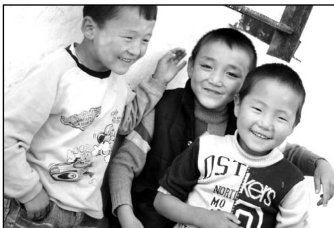
Tre gutter som leker utenfor internatet.

Ved to anledninger observerte jeg at ansatte tok frem en gitar og spilte for barna. Det samlet seg da mange barn for å høre på. Jeg observerte også ved en