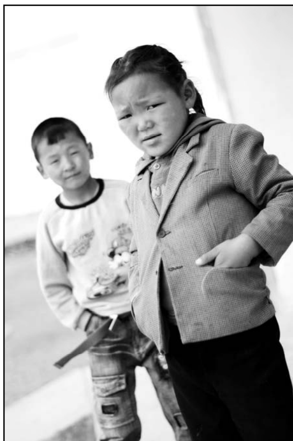
En jente og en gutt som er ute på trappen til internatet.

Samtlige av de ansatte synes det er viktig at barna får tid til å være sosiale og leke. Flere av de ansatte mener at det er for mye tid tilgjengelig til frilek. Fire av de ansatte trekker frem at internatet har en aktivitetsplan som de følger slik at barna kan delta i organiserte aktiviteter. En av de ansatte trekker frem at det er laget en aktivitetsplan, men at den ofte blir forsømt og at barna derfor ofte er i frilek eller sitter på rommene sine på fritiden.