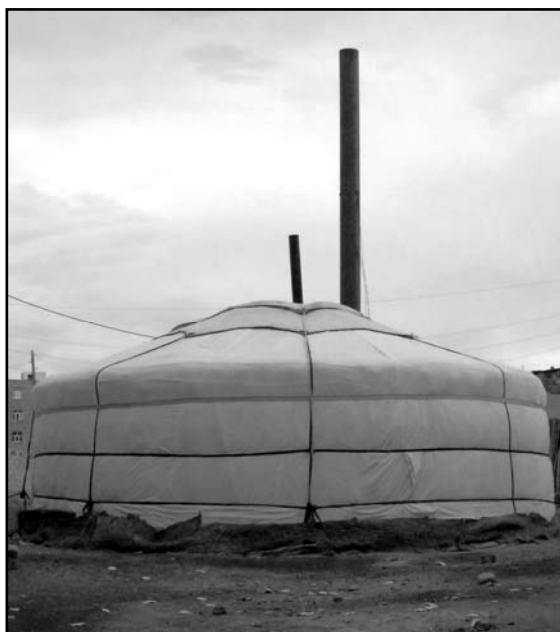
Mongolsk "ger."

I Khovdprovinsen er befolkningen på om lag 90.000, hvor 30.000 av disse bor i Khovd by. Resten bor i utkantstrøk som eksempelvis Myangad som er en