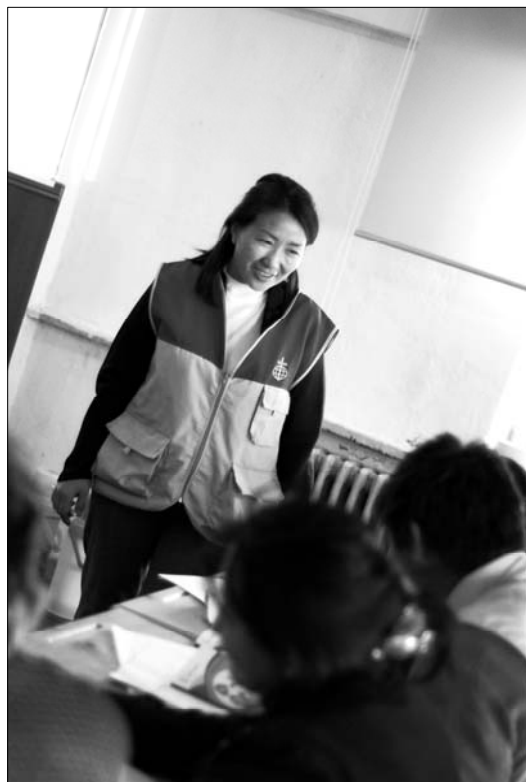
NLM ansatt i samtale med kursdeltagere ved internatet.

Arbeidet ved internatet er et av hovedsatsningsområdene i SCR prosjektet. NLM jobber for at miljøet ved internatet skal bli bedret samtidig som de ønsker å øke